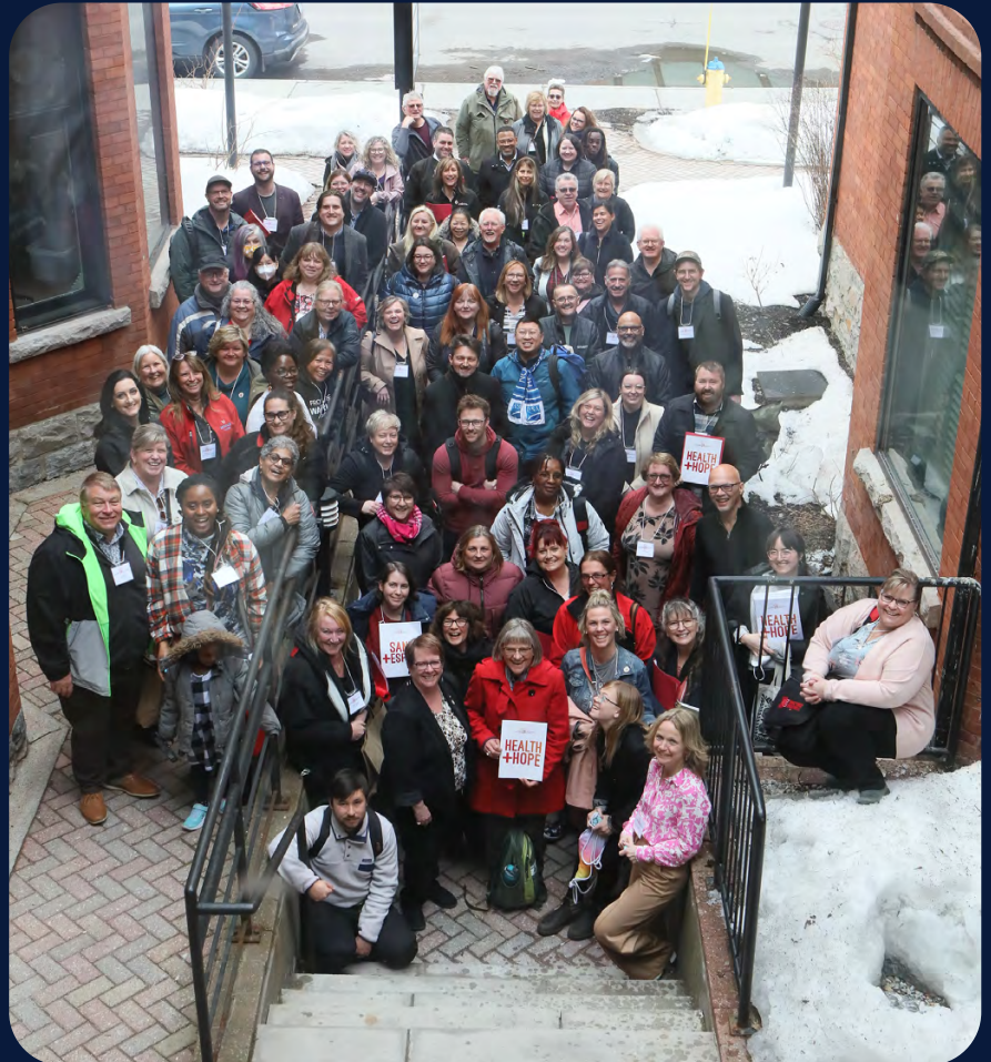
Plus de 100 bénévoles reçoivent une formation en lobbying. 27 mars 2023, Ottawa.