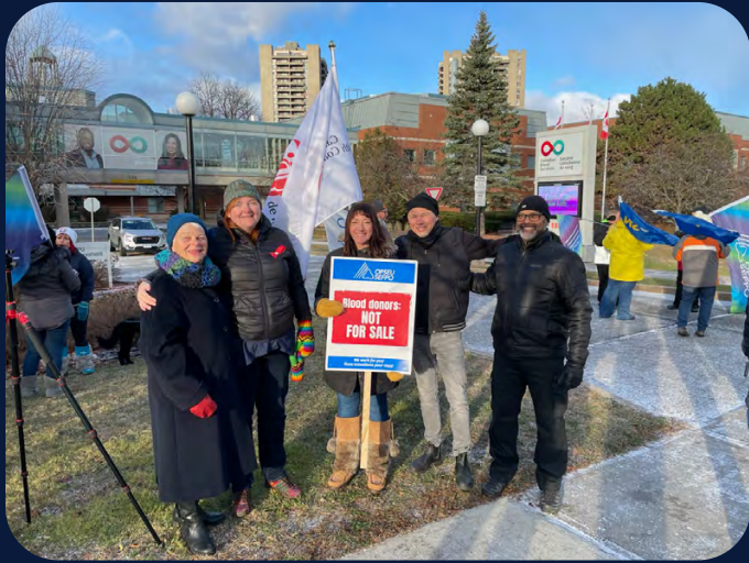
La Coalition se joint aux travailleurs et aux militants devant les bureaux de la Société canadienne du sang en appui à la collecte de plasma à partir de donneurs volontaires. 2 décembre 2022, Ottawa.